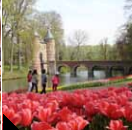
KASTEEL VAN GROOT-BIJGAARDEN BRABANTE FLAMENCO